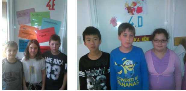
( A logikai matematikaverseny résztvevői )

Szép olvasó verseny a felújított iskolai könyvtárban került megrendezésre.