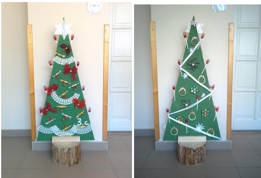
( 3.c osztály nyertes karácsonyfája )